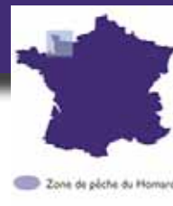
Zone de pêche du Homard