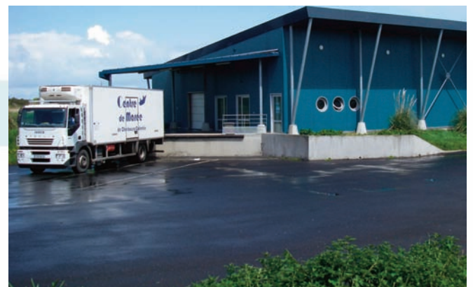
Ci-dessus, le centre de débarque de Barfleur. Celui-ci est géré par le Centre de Marée de Cherbourg-Cotentin.