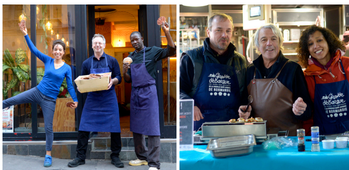
De gauche à droite : l'équipe du Piano Perché à Paris et l'équipe d'animation accueillie à la poissonnerie des Halles de Rouen.