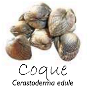
Coque Cerastoderma edule