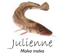
Julienne Molva molva