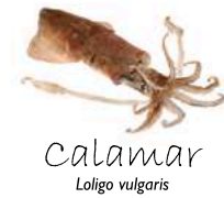
Calamar Loligo vulgaris