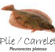
Plie / Carrelet Pleuronectes platessa