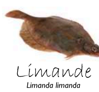
Limande Limanda limanda