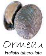
Ormeau Haliotis tuberculata