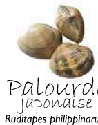
Palourde japonaise Ruditapes philippinarum