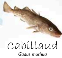
Cabillaud Gadus morhua