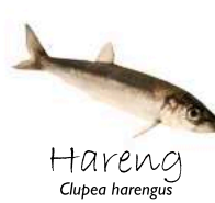
Hareng Clupea harengus