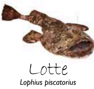
Lotte Lophius piscatorius