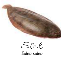
Sole Solea solea