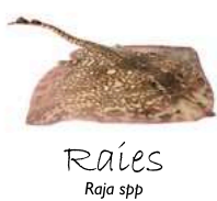
Raies Raja spp