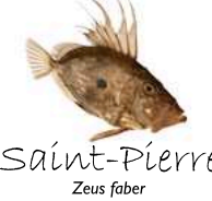
Saint-Pierre Zeus faber