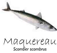
Maquereau Scomber scombrus