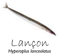
Lançon Hyperoplus lanceolatus