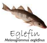
Eglefín Melanogrammus aeglefinus