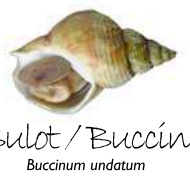
Bulot / Buccin Buccinum undatum