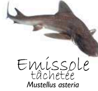
Émissolle tachetée Mustellus asteria