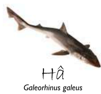
Hâ Galeorhinus galeus