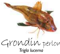
Grondin perlon Trigla lucerna