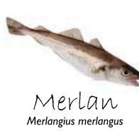
Merlan Merlangius merlangus