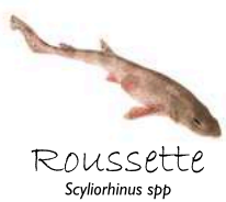
Roussette Scyliorhinus spp