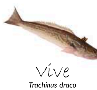
Vive Trachinus draco