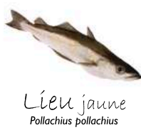
Lieu jaune Pollachius pollachius