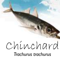
Chinchard Trachurus trachurus