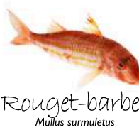
Rouget-barbet Mullus surmuletus