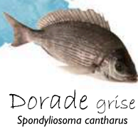
Dorade grise Spondyliosoma cantharus