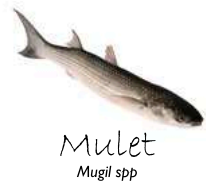
Mulet Mugil spp