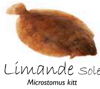
Limande sole Microstomus kitt