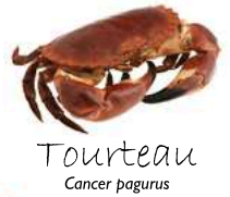
Tourteau Cancer pagurus