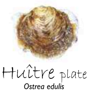
Huître plate Ostrea edulis