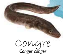
Congre Conger conger