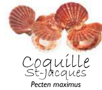
Coquille St-Jacques Pecten maximus