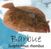
Barbue Scophthalmus rhombus