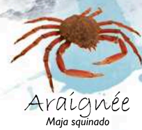
Araignée Maja squinado