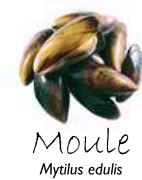
Moule Mytilus edulis