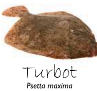
Turbot Psetta maxima