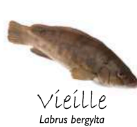
Vieille Labrus bergytta