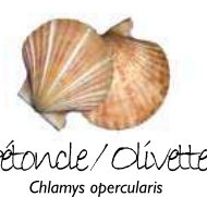
Pétoncle / Clivette Chlamys opercularis