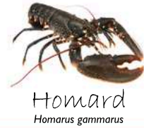
Homard Homarus gammarus