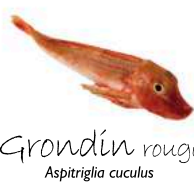
Grondin rouge Aspitriglia cuculus