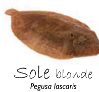
Sole blonde Pegusa lascaris