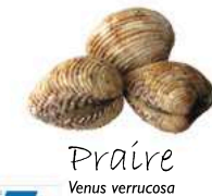
Praïre Venus verrucosa