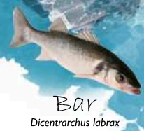
Bar Dicentrarchus labrax