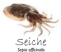
Seïche Sepia officinalis