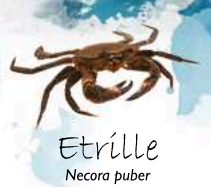
Etrille Necora puber